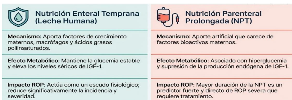
Tabla 2. Efectos de la Leche materna y la Nutrición parenteral en el riesgo de desarrollar ROP.