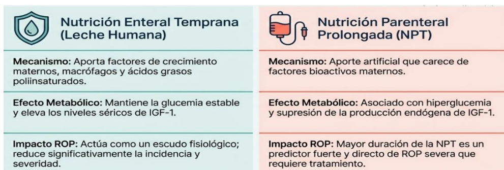
Tabla 2. Efectos de la Leche materna y la Nutrición parenteral en el riesgo de desarrollar ROP.