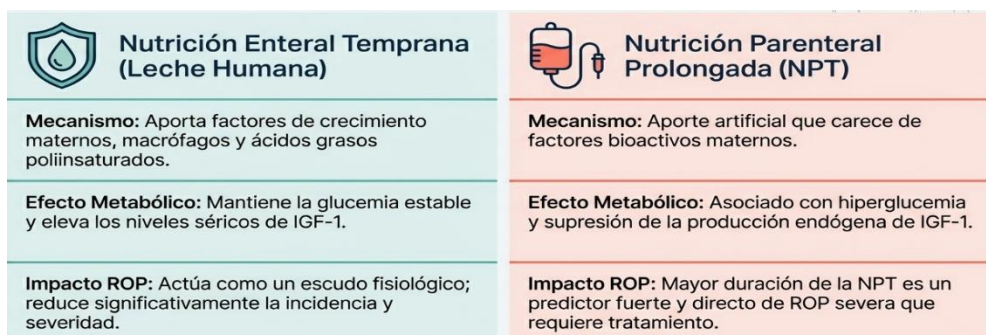
Tabla 2. Efectos de la Leche materna y la Nutrición parenteral en el riesgo de desarrollar ROP.